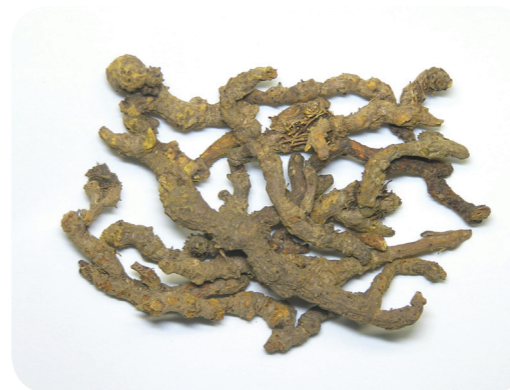
写真3 オウレン（黄連）