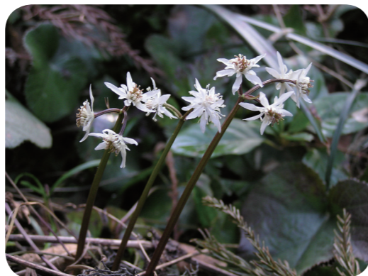
写真1 オウレン（両性花）

キクバオウレンは北海道南西部と本州に分布し，山地の樹林下の湿ったところに良く生え，高さ 15～40 cm になる常緑の多年生草本です。花をよく見ると，雄し