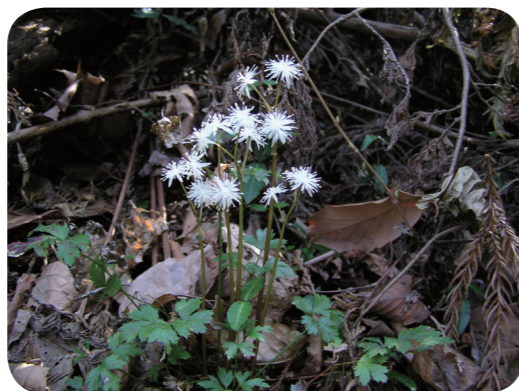
写真2 オウレン（雄花）