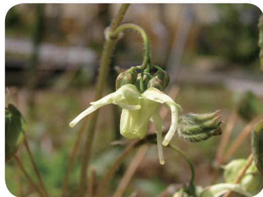
写真2 キバナイカリソウ (花)