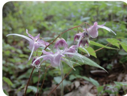
写真1 イカリソウ (花)

4月、木々が芽吹き、山々が緑に染まる頃、山歩きをすると淡い赤紫色で船の錨に似た花を付けた草本を見かけます。これがイカリソウです。本植物は主に本州の太平洋側から四国にかけての丘陵や山裾の雑木林などに自生する多年草で、高さ20～40cm、茎は数本そう生し、葉は紙質で裏面に毛があります。葉は長い柄をもち、3つに枝分かれした先に3枚の小葉のある1～3回三出複葉をつけ、小葉は側方と中央でやや形の異なる柄を持ち、卵状皮針形、辺縁には刺毛状の小さきよ歯があります。4～5月ごろ、茎の途中から長い花柄を出し総状花序をつけ、花は淡紫紅色のものが多く白または淡黄色のものもあります。4枚の花弁には長さ2cmに及ぶ長い距(きょ：細く突き出した部分)があり、花は細い花茎の先に短い穂になって咲き下に垂れます。花茎は葉群の上に出るものと下になるものがあり個体差や地域差が見られます。イカリソウの仲間はいくつかの種があり、これらの茎と葉をインヨウカク(淫羊藿、別名：仙霊脾、 Epimedii Herba )とよび精力剤として有名です。本来の淫羊藿は中国原産の同属のホザキイカリソウ E. sagittatum