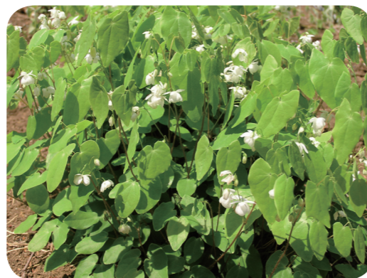
写真3 バイカイカリソウ (花)