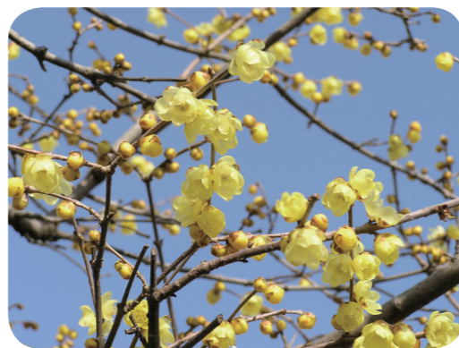
写真2 ソシンロウバイ (花)