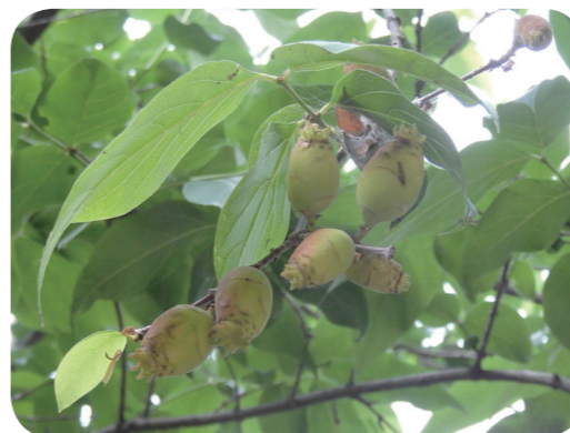
写真5 ロウバイ (果実)