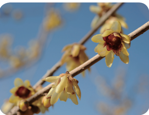
写真1 ロウバイ (花)

ロウバイの名は漢名の「臘梅」の音読みですが、花が蜜蝋（ミツバチの巣を加熱・圧縮して採取した蝋で、艶出し剤、化粧品などに利用される）を連想させるからとも、臘月（陰暦12月の異称）にウメに似た香りの花をつけるからともいわれています。ロウバイには香りが強く、内側の花被片も黄色いソシンロウバイ var. concolor Makino（素心臘梅）や花が大きいトウロウバイ var. grandiflorus (Lindl.) Makino（唐臘梅）などの園芸品種があります。薬用としては、1月中旬ごろ、開花前の花蕾を採取し、風通しの良い場所で、陰干しにしたものを「臘梅花」といい、 ねつびょうほんかつ 熱病煩渴、解熱、鎮咳、鎮痛薬として咳嗽、小児麻痺、百日咳、やけどなどに用います。成分については、花蕾に cineol, borneol, linalool, camphor, 種子にアルカロイドの calycanthine などを含み、calycanthine は動物に対して、ストリキニーネ様の作用を示し、ウサギの摘出腸管、子宮に対して