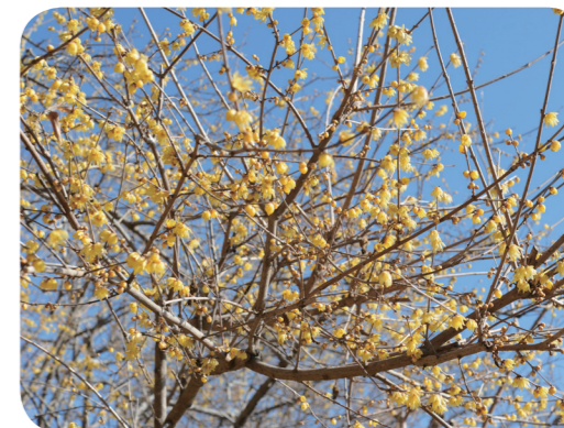
写真4 ロウバイ (遠景)