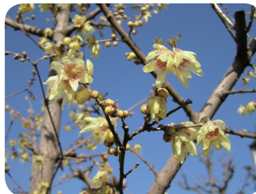
写真3 トウロウバイ (花)