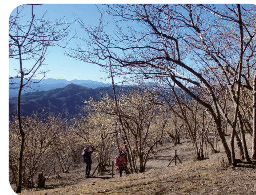
写真6 臘梅園 (宝登山)