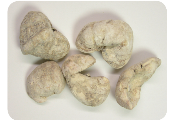
写真4 生薬：バイモ (貝母)

といい、日本でも奈良県などで栽培され、大和貝母ともよばれています。また、生薬のバイモは鎮咳、去痰などを目的に用いられてきましたが、同名の生薬でも熱感があって痰のとれにくい咳嗽には浙貝母を用い、元気がない肺燥の咳嗽には川貝母を用いるとされています。