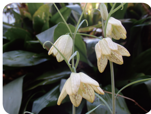
写真1 アミガサユリ

鱗茎を剥がし、水洗いしながら外側のコルク皮を捨て、日干し、または石灰を塗って乾燥させた鱗茎は、バイモ（貝母, Fritillariae Bulbus ）といい、鎮咳、去痰、排膿などを目的に滋陰至宝湯、清肺湯、当帰貝母苦参丸料などの漢方処方に用いられます。成分としては、鱗茎にステロイドアルカロイドの peimine (verticine), peiminosite, peiminine, peiminone などが報告されています。これらのアルカロイドには血圧降下作用が報告されていますが、一方、心筋を侵す作用があることから注意が必要です。中国に産する生薬のバイモには何種類もの Fritillaria 属植物を基原とするものがあり、それぞれ浙貝母、川貝母などとよばれ、そのうちアミガサユリを基原とするものは浙貝母