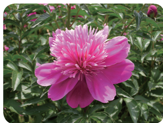
写真3 シャクヤク（花）C