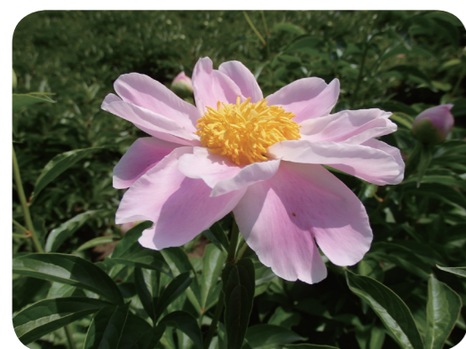
写真2 シャクヤク（花）B