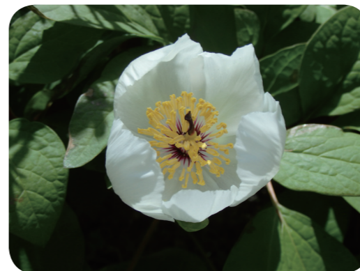
写真4 ヤマシャクヤク（花）