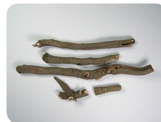
写真8 生薬：ボタンピ（牡丹皮）