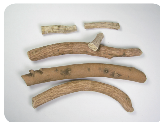
写真7 生薬：シャクヤク（芍薬）