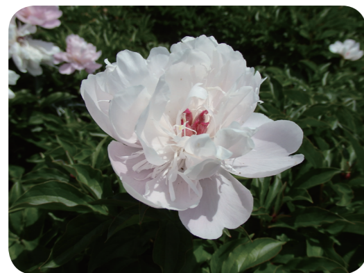
写真1 シャクヤク（花）A

王」とよばれるに対し、シャクヤクは草本で「花の宰相：花相」とよばれます。シャクヤクはよくボタンの台木として使用されることから鑑賞用のボタンの根は薬用のボタンピ（牡丹皮）としては不向きです。乾燥した根は、生薬名をシャクヤク（芍薬, Paeoniae Radix ）といい、収れん、緩和、鎮痙、鎮痛作用があることから筋肉のこりの緩和、腹痛、身体疼痛、腹満、下痢、化膿性疾患等改善のため、葛根湯、芍薬甘草湯、当归芍薬散、加味逍遥散をはじめ、多くの漢方処方に配合されます。根には変形モノテルペン配糖体の paeoniflorin, oxypaeoniflorin,