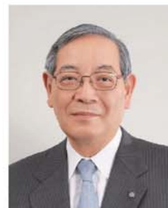
城西大学学長 森本 雍憲

機関リポジトリは、大学が生み出す知的成果を広く社会と共有し、大学の教育・研究・社会活動を社会に還元する役割を担っており、世界中で設置されています。2013年3月現在のOpenDOARの統計では、世界のリポジトリ数は2,260以上も存在しています。日本でも、2013年2月末現在227のリポジトリがあり331機関で公開されており、そのコンテンツ数は100万件以上に上るといわれています。