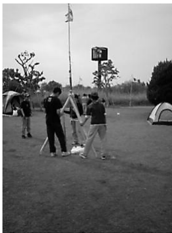
写真2 班旗立てゲームの様子

まず、「①われわれ意識」を高めるため、班の仲間意識を高めるような指導が班長以下班員に対して行われる。また、班のシンボルを描いた「班旗」を作成することなども奨励される。BS隊の活動で行われるプログラムも「班の協調性」を高めるようなものが選ばれ、たとえば、先ほどの班旗を利用して、ロープと棒を利用し、どの班が早く班旗を立てることができるかを競う「班旗立てゲーム」と言ったプログラムも行われる。班の役割分担を明確にし、班全体が協力することが求められるようなプログラムとなっている。