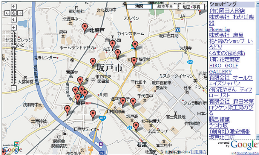
図2 GoogleMapAPIを用いて作成した店舗情報の画面（ショッピングのカテゴリー）