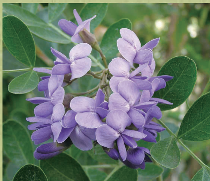
Texas Mountain Laurel (3月) (温室)