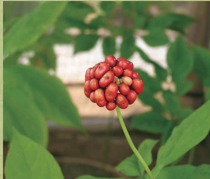
オタネニンジン (8月)