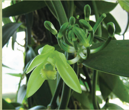
バニラ (2月) (温室)