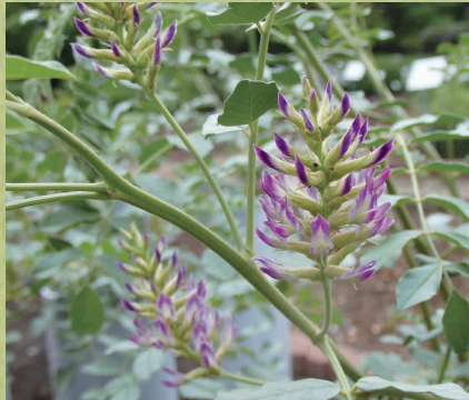
ウラルカンゾウ (5月)