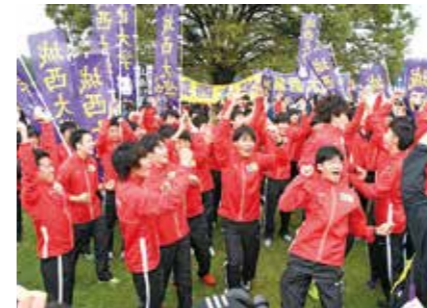
予選突破が決まり歓声をあげる選手たち

第94回東京箱根間往復大学駅伝競走（箱根駅伝）の予選会は10月14日、東京都立川市で行われ、男子駅伝部は10時間8分50秒で総合8位となり、2年ぶり14回目