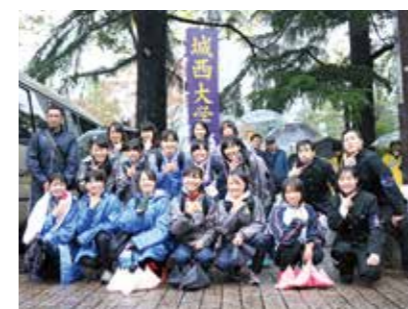
第35回大会レース後に笑顔を見せる選手たち

宮城県仙台市で10月29日に行われた第35回全日本大学女子駅伝対校選手権大会（杜の都駅伝）で、女子駅伝部は2時間8分46秒で8位入賞し、6年ぶり16回目のシード権を獲得しました。