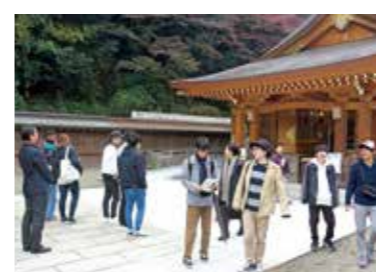
高麗神社を見学する学生たち

後期の全学部授業である「地域と大学」が行われています。城西大学にあるミュージアムのほか、近隣地域などの施設について見学、体験して具体的に学んでいます。地域の文化施設について関心を持ち、課題を発見する力を身につけるとともにグループワークを通して問題意識を深めることが狙いです。