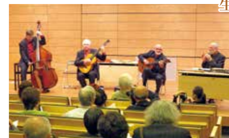
演奏するカラカ音楽楽団

東京紀尾井町キャンパス1号棟ホールで10月6日、「文学と音楽の夕べ」が開かれました。ハンガリーの偉大な詩人、アラニュー・ヤーノシュ