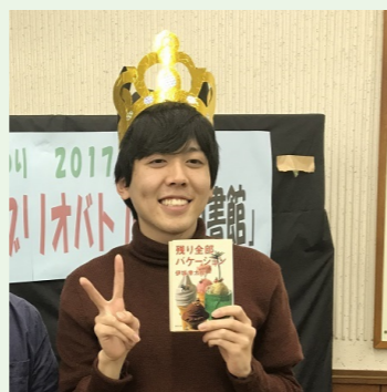
笠原さん「第3回ビブリオバトル坂戸図書館」で