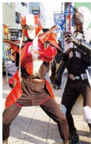
“2人のJ”(左:リベレスパーJ、右:ルーガライザーJ)

4年生による「リベレスパーJ」は、今回が実質最後のステージショー。3年生による新ヒーロー「ルーガライザーJ」は11月12日に行われた「鶴ヶ島産業まつり」で初ステージを披露しました。