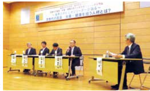
パネルディスカッションの様子

東京紀尾井町キャンパス1号棟ホールで11月25日、シンポジウム「次世代の医薬・栄養・健康を担う人材とは？」が開かれました。大学院薬学研究科が主催し、薬剤師や関係者、本学の学生・教職員ら約100人が、各界のオピニオンリーダーによる提言や討論に熱心に耳を傾けました。