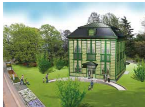
旧忍町信用組合店舗の復元完成予想図

プロジェクトは昨年8月からスタートしました。行田市の保健センターで管理栄養士として働く卒業生からメニュー作り事業への協力を求められたのが、きっかけでした。カフェメニューの開発に手を挙げたのは、1年生11人と2年生6人の計17人。条件は、行田の農産物を使って500円以内で提供できる軽食で、旧店舗は市の文化財で火が使えないため、加熱は電気調理器に限るなど。学生たちは、試作と2回の修正を経て今年1月に20のレシピを完成させました。特産の青大豆や小松菜、蓮の実などを使った「大豆を使ったオムライス」や「小松菜のジェノベーゼ」「蓮ごはんと甘口豆乳梨カレー」「豆乳茶碗蒸し」など、おいしそうな料理が並んでいます。カフェでは、移築・復元が完了する10月以降、このレシピから10品目程度を提供。市では公開されるレシピで家庭や集会でもカフェ料理を楽しんでもらうことにしています。