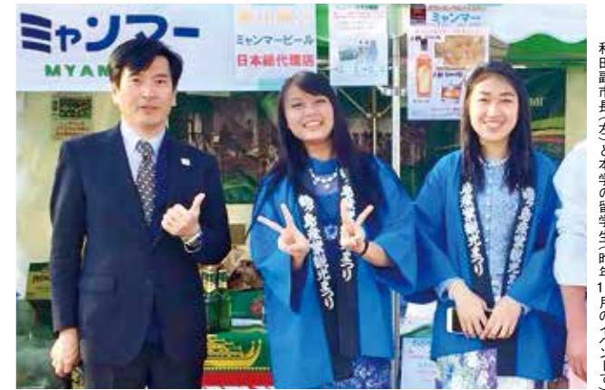
和田副市長（左）と本学の留学生昨年11月のイベントで

ありますが、市ではホストタウンの取り組みを通して、市民、子どもたちが世界に目を向け、その中で自分たちが地域でできることを実践していく機会にしていきたいと考えています。こうした経験は、次代を担う子どもたちをはじめ、市にとっても大変貴重なものと考えています」