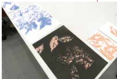
完成した作品(一部)