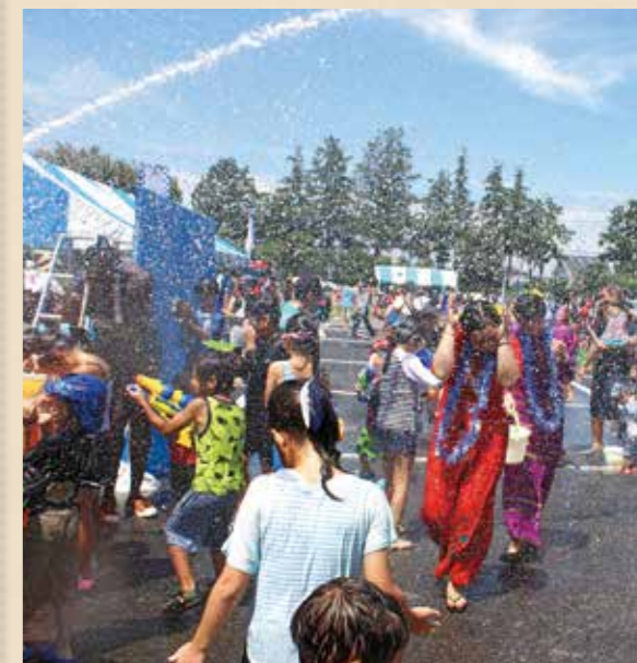
昨年の「鶴ヶ島水かけまつり」の様子

脚折雨乞に使われる龍蛇のパレードやミャンマー料理など楽しめる屋台の出店も予定していますので、ぜひ遊びに来てください。2020年に向けたミャンマーとの交流。皆さんもミャンマーを身近に感じてみませんか。