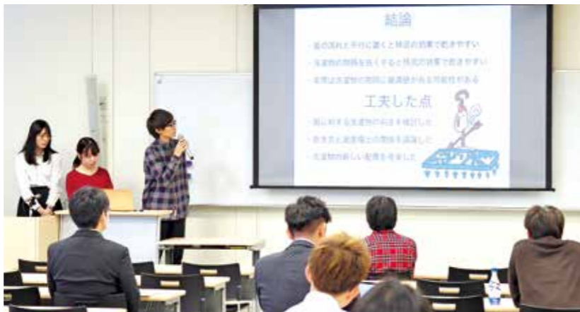
藤田セミナーでの発表風景