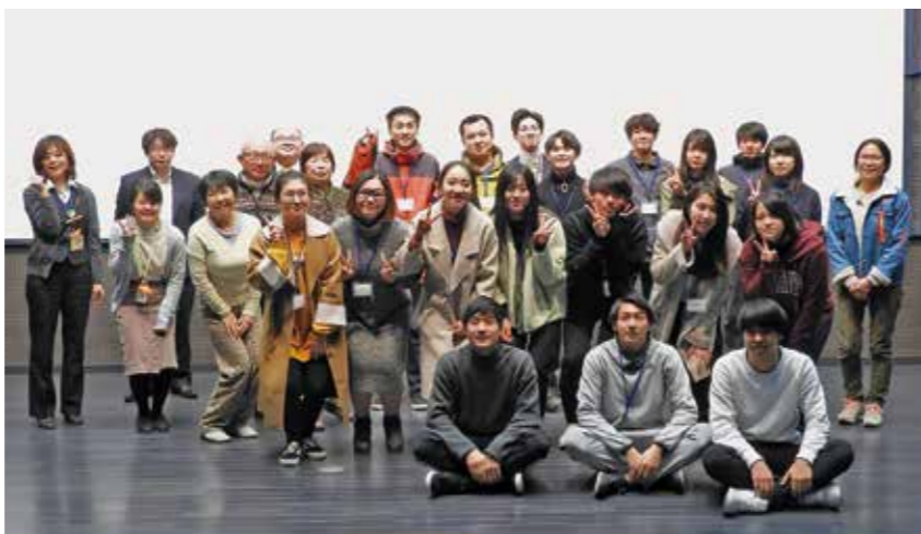
報告会後皆で「パチリ」

おれんじカフェ 認知症カフェとも言われ、認知症の方とその家族、地域住民や専門職など誰でも参加でき、気軽にお茶を飲みながら認知症や高齢者などに関する相談や意見交換を行う場所。認知症サポーターの人が目印として、オレンジ色のプレスレット(オレンジング)を付けていることから、こう呼ばれています。