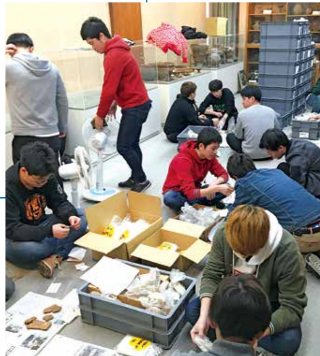
石井ゼミによる考古資料の整備作業