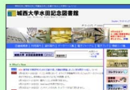
ホームページは検索の拠点です

ホームページには最新情報をいち早く掲載。他にも学力補強ムービーや城西大学の研究論文を集めた機関リポジトリ「JURA」など図書館のさまざまな機能にアクセスすることができます。