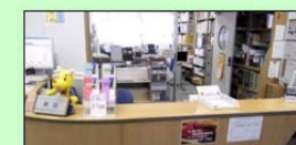
カウンターでは貸出・返却・延長のほか、各種学習のサポートも行っています。

図書館ではこのほかにも、各種データベースの利用講習会や各学年に合わせた図書館ガイダンスを開催しています。