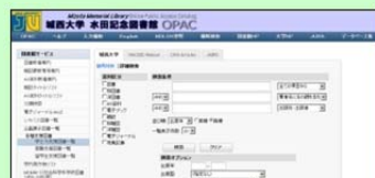
OPACで資料の検索ができます