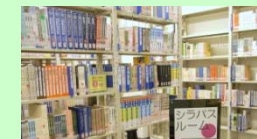
<3階シラバスルーム> 授業の教科書、参考書