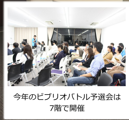
今年のビブリオバトル予選会は 7階で開催