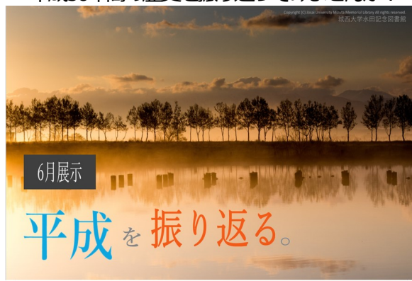
黄金の輝き(福島湾)

改元を記念して「平成」にまつわる図書や雑誌を展示しています。 平成30年間の歴史を振り返ってみませんか？