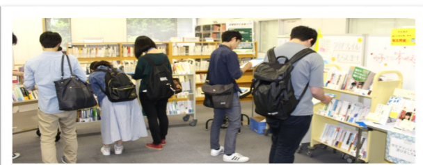
学生選書の様子。みんな熱心に選んでくれました！

6月18日に開催した「学生選書」にて参加者に選ばれた本96冊が1階展示コーナーに並んでいます。