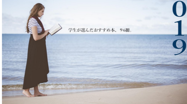
学生が選んだおすすめ本、96冊。

学生選書で選ばれた図書を、1階で選書コメントとともに紹介しています。選んだ学生はもちろん、当日参加できなかった方も、ぜひ手に取って借りてみてください。