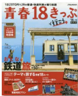
『青春18きっぷで行こう』 JTBパブリッシング.2018

「るるぶ」や「ことりっぷ」など、旅行のお供に借りてはいかがでしょうか。1階の旅行留学ガイドブックコーナーへどうぞ ☆ミ