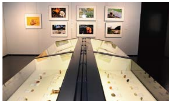
根付コレクションと写真の展示