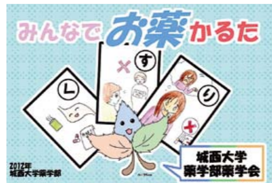
「みんなでお薬かるた」パッケージ

今後、このかるたを近隣の学校や地域の児童館・公民館などにも配布して使っていただく予定で、さまざまところで広く使用していただくことで、次世代を担う子供たちが「医薬品の正しい使い方」を学ぶことに少しでも貢献できれば幸いです。