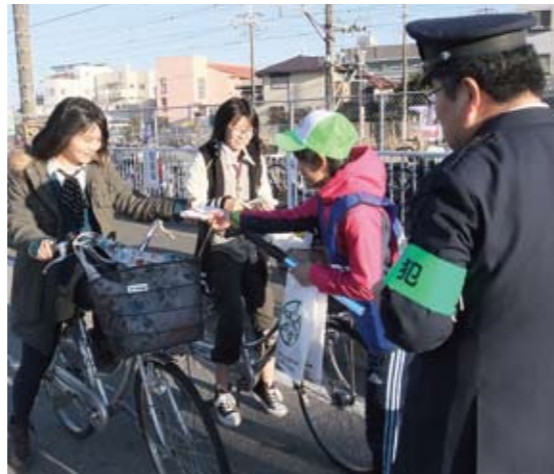
啓蒙活動を行う学生たち

本学は、今後もこのような活動を継続し、東金市内および大学近隣の安全・安心の向上に貢献していきます。