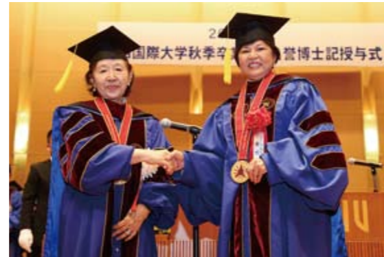
理事長とン・イェン・イェン大臣

ン・イェン・イェン大臣は、2009年より現在の観光大臣としてマレーシアの観光振興に多大な功績を収め、先駆的な女性リーダーとして高く評価されています。本学と同国との国際交流プログラムの構築にも関わり、国際教育分野においてこれからのグローバル社会で、アジアの時代を見据えた多大なる尽力が評価され、今回の名誉博士記授与となりました。