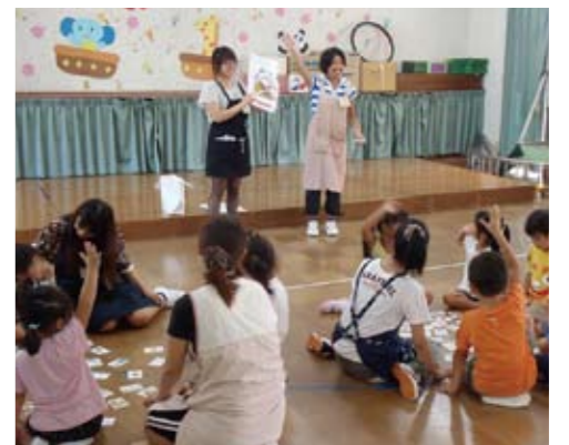
栄養かるたを使った食育活動

今回の訪問活動では、まだ文字が読めない子どもでも分かるように、大きな絵札やかるたの中に登場する実際の食品を用意したり、また、クイズ形式で質問に答えてもらうなどの工夫をして、子どもたちも皆目を輝かせて栄養かるた遊びを楽しんでいました。終了後には、園長先生をはじめ保育士の皆さんと事後検討会を実施し、園長先生から今後も定期的な開催をお願いされました。