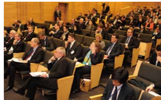
22カ国の大使館関係者が参加