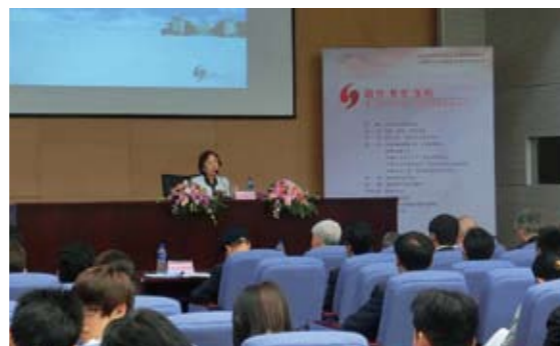
特別講演のようす