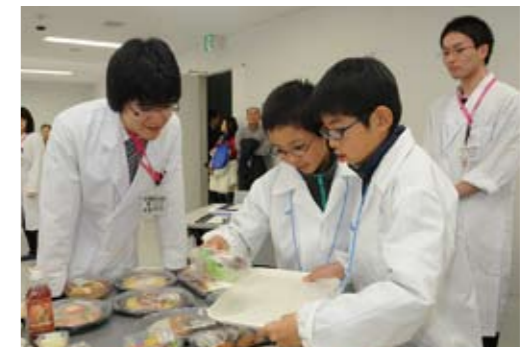
管理栄養士を体験