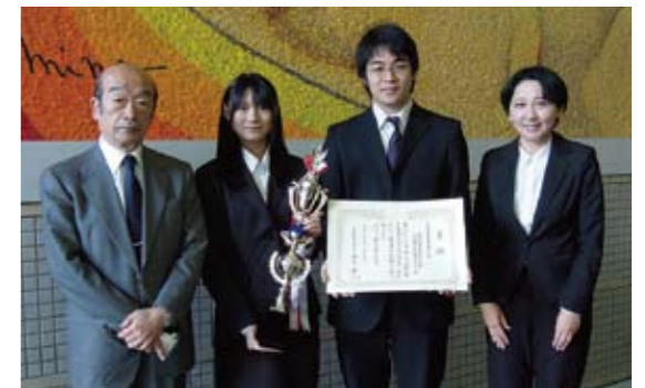
表彰状とトロフィーを受け取って