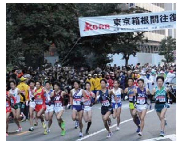
10年連続、10回目の出場を果たす

2014年は予選会からの出場となりますが、選手全員が今年大会の悔しさを晴らすべく練習に励み、地域の皆様の期待にお応えできる活躍を目指します。