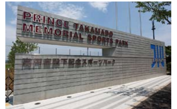
スポーツパークメモリアルゲート