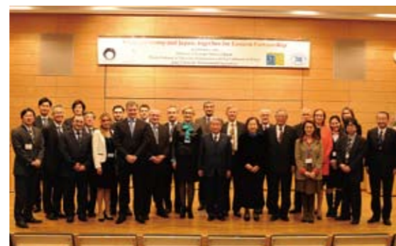
セミナー終了後の記念写真