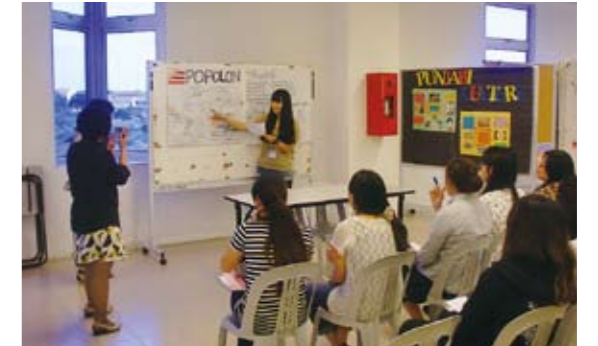
英語集中研修プログラムの様子

今回は、城西大学および城西国際大学から合計約90名もの学生が参加し、UTARの英語教員が主体となって研修が行われました。授業は、英語レベル別に5つのクラスに別れて1日6時間×10日間というハードな集中講義でしたが、英語によるゲームやディスカッションなども含め、学生たちは楽しみながら英語力を高めることができました。また、英語以外にもペラ州の地域振興について学んだり、UTARの学生たちとの交流を通じて様々な文化を体験して海外を肌で感じて多文化社会理解と国際交流を深め、これまで以上にグローバルな視野を身につけることができました。