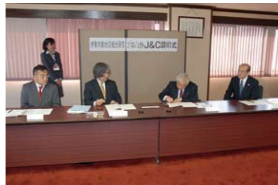
プロジェクトの調印式

本プロジェクトにおいて、観光学部はイベント時の運営補助やアンケート調査等の活動を行いました。本学は、このプロジェクトの活動を、将来のグローバルな観光人材を目指して学ぶ学生たちにとって有意義な機会にするとともに、このプロジェクトの活動を通じて、伊東市の観光産業振興に貢献をしていきたいと考えます。