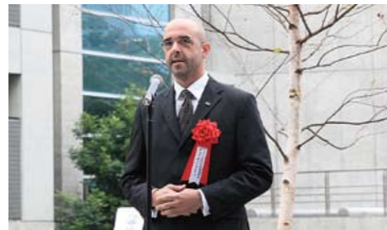
挨拶をするハンガリーのコヴァーチ・ゾルターン行政・法務副大臣

ワレンバーグ氏は1912年生まれのスウェーデン人で、ナチスに占領されたハンガリーに、スウェーデンの外交官として赴任後、保護証書をユダヤ人に配布するなど、ユダヤ人の救出に奔走しました。1981年、アメリカがワレンバーグ氏に名誉市民権を授与したほか、カナダ、イスラエルでも名誉市民となりました。