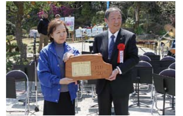
片桐市長より感謝状の授与

句は「どの道も ゆくも大連 花槐」で、水田三喜男生家近くの桜の美しい嶺岡林道に建立しました。