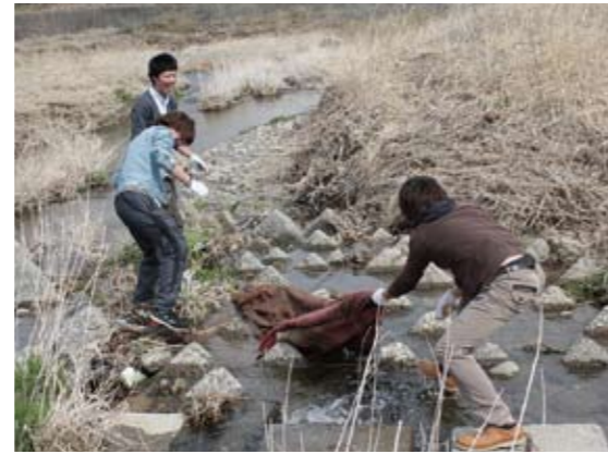
高麗川の粗大ゴミを回収

そして、2015年の創立50周年に向けて、これまでの諸活動を統合し、大学と地域、行政との3者の連携に基づく教育活動や共同体意識の啓発を支援・推進することを目的とし、高麗川の粗大ゴミを回収