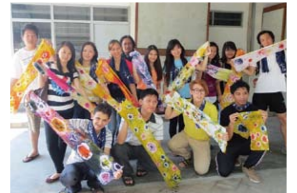
伝統染物の授業を終えて

このプログラムは、従来の語学研修だけでなく、英語を用いて東南アジア諸国の経済、農業、環境、工学などの多岐にわたる専門科目を学ぶことを目的に開催されたもので、第1回目となる今回は、インドネシア第2の都市であるスラバヤ市にあるペトラ・クリスチャン大学にて、2012年7月16日～8月3日の日程で行われました。本学からは城西大学、城西国際大学から18名が参加し、参加7大学合計で約150名が一同に介しました。