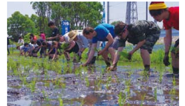
国際色豊かな学生たちによる田植え

環境社会学部では今後もJIU農園をフィールドに、6次産業型の地域活性化プロジェクトに取り組んでいきます。