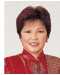
マレーシア観光大臣 ダト・スリ・ドクター・ン・イェン・イェン氏

学校法人城西大学では、早くからウェルネスツーリズムの重要性・可能性に注目して2006年に城西国際大学に観光学部を設立、日本における観光学の魁として、語学・IT・リスク管理も含めたウェルネスツーリズムの学びを展開されてきました。