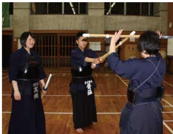
女子剣道部員が中学生を指導

生徒たちは学校での練習の後、自己研鑽のため保護者と共に参加しています。まだ始めたばかりの指導ですが、生徒一人ひとりの日頃の練習の成果が目に見える形で着実に現れており、生徒のご父母からも数多くの感謝の言葉をいただいています。本学の学生も、指導しながらも「自らの剣道を正し、共に学ぶ」ことを基本に置き、『素直な心と感謝の気持ち』が大切であるという、自らが学んだことを次の世代にも伝えたいという思いで熱心に指導にあたっています。また同時に、将来教員を目指す学生たちにとっても、剣道の指導を通じて教育の喜びと難しさを肌身で感じるなど、学生たち自身も大いに刺激を受けて日々成長を重ねています。