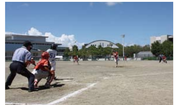
ソフトボール大会 熱戦のようす