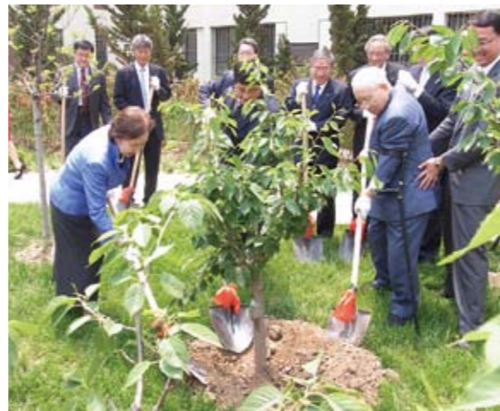
大連理工大学での水田桜の植樹式

今後の各大学での水田桜の成長とともに、本学との交流がこれまで以上に一層深まっていくことが期待されます。