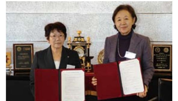
越生町との協定締結