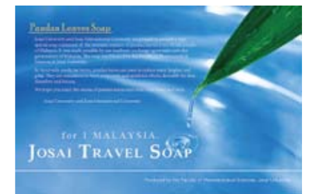
パンダンリーフ石鹸のパッケージ

本学は、2010年にマレーシアのマネジメント&サイエンス大学と学術交流協定を締結し、本学薬学部と教員および学生の交流を続けています。さらに2011年には、同国観光大臣・イエン・イエン氏が東京紀尾井町キャンパスに来学、その後もマレーシアの他大学との協定も締結するなど、近年マレーシアの大学と活発な交流を行っています。