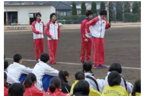
本学陸上競技部のバトンプスデモンストレーション

本学は野球、駅伝などの種目に続き、陸上競技部も着実に結果を残しつつあります。今回の学会によって多くのスプリント関係者に城西大学を知っていただく事ができたと同時に、本学陸上競技部の学生にとっても、今学会大会を運営することで大変貴重な経験を積むことができました。