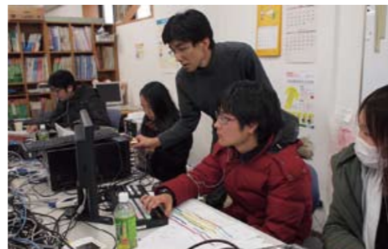
銚子駅伝を中継するプロジェクトメンバーたち