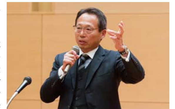
講演する岡田特任教授

岡田氏は、現在は中国サッカー・スーパーリーグの杭州绿城足球倶楽部で監督を務められていますが、杭州绿城監督就任への経緯やそこに賭ける思い、可能性を秘めた選手たちの意識改革策、そして枠組みや価値観が変わっていく社会で活躍する若者に求められる、本質を見抜く力の重要性など、氏の豊富な指導経験に基づく持論を熱く語り、会場を埋めた多くの学生や近隣から参加された聴講者達を魅了しました。