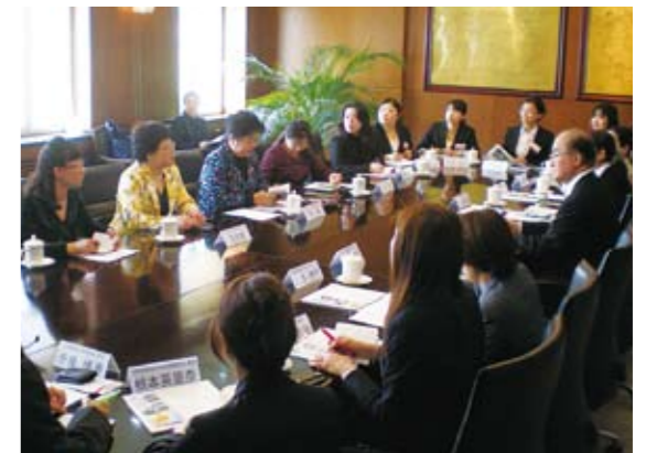
大連市政府とのミーティング

今回、参加した社会人は、マスコミ、法律、教育、企業など幅広い分野で活躍する女性たちです。こうした社会人と大学院生が、それぞれの立場を越え、「女性」として共有できる問題意識を明確にし、意見交換を行うことができたことは研修の大きな成果となりました。