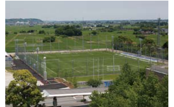
スポーツパーク全景

同施設は、本学サッカー部が試合・練習などに利用するほか、青少年の育成など地域のスポーツ振興に生かしていくとともに、スポーツを通しての国際親善・交流活動の拠点としても活用されています。