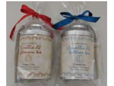
V4オリジナルハーブティー

本学との国際交流で縁の多い中欧のヴィシエグラード4カ国(V4:チェコ、ハンガリー、ポーランド、スロバキア)にちなんだハーブを用いた、ヘルシーな紅茶(ハーブティー)です。紅茶の原料となる「茶の木」の学名Camellia sinensisにちなんで、この紅茶を「Camellia JU Tea」と名づけました。紅茶をベースにリラックス効果があるアロマなども取り入れ、誰もが安心して美味しく飲める香り豊かなお茶に仕上げました。そして、午後のリフレッシュ時に合う「Camellia JU afternoon Tea」と、就寝前に最適な「Camellia JU bedtime Tea」の2種類に仕上げられています。