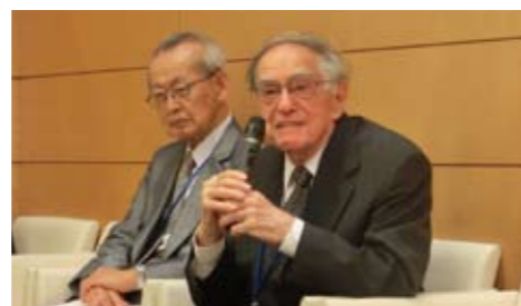
レセプションでのドナルド・キーン氏スピーチ