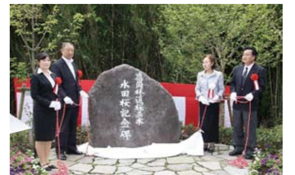
水田桜記念碑の除幕