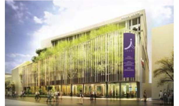
3号棟完成イメージ

東京紀尾井町キャンパスは、城西大学・城西短期大学の坂戸キャンパスと、城西国際大学の東金・安房・幕張キャンパスを結ぶものとして学校法人城西大学の創立40周年を記念して2005年に開設されたもので、都心の中心地にあるキャンパスとして3大学の学生と大学院生が学んでいます。また、就職センターや国際学術文化交流センター、女性センター、生涯教育センターなども設置し、研究、国際交流、就職活動支援など、学生へ幅広い支援を行うとともに、首都圏の中心地であるメ