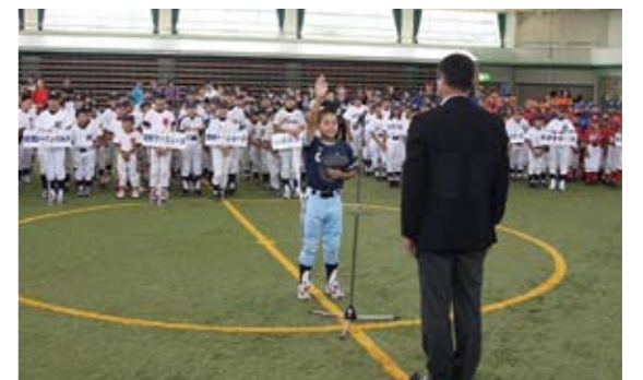
少年野球大会 元気に選手宣誓

参加高校は地元近隣9高校で、参加選手を含めて合計220名の方が来学されました。本学女子ソフトボール部員が事前準備も含め大会運営全般に協力し、ソフトボール部員のきびきびした対応は、各高校や応援の保護者の方々からお褒めのお言葉をいただきました。二日目に各リーグの決勝トーナメントが行われ、1位リーグに進出した千葉黎明高校、幕張総合高校、成田国際高校の3校が決勝を戦い、見事千葉黎明高校が1位になりました。