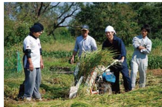
酒米を収穫する学生達

なお、この「休耕地活用プロジェクト」は、埼玉県「農との共生田園都市豊かな暮らし満喫事業」として採択されています。