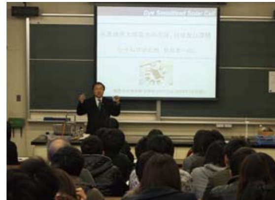
理学部での公開授業の様子

なお、城西大学では、理学部化学科でも2010年度から同様の公開授業を行っており、高校生が大学生と一緒に「生活と化学物質」に関する講義を受けて学んでいます。