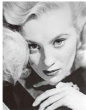
マイ・ゼッターリング(1925 - 1994)