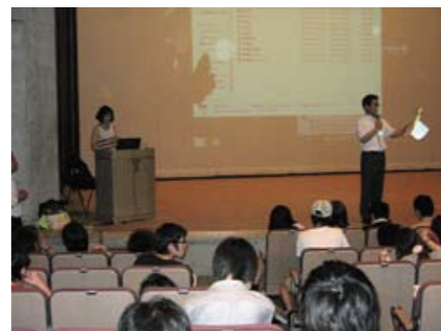
講座講師と解説する草野教授