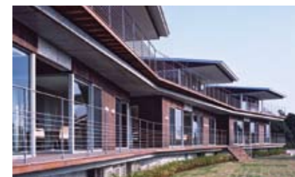
❖ 鋸南セミナーハウス

その心地よさと周囲の景観にふさわしい建物であることが評価され、千葉県建築文化賞と東京建築賞において「優秀賞」を受賞しました。