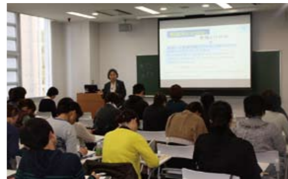
教育研修で熱心に学ぶ受講者たち