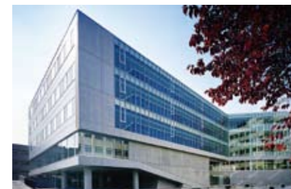
❖ 城西大学 経営学部棟

AIAは2008年度にはじめて教育的な建物(2001年1月11日以降完成の建物)についての部門を設け、その栄えある第一号を経営学部棟が受賞しました。