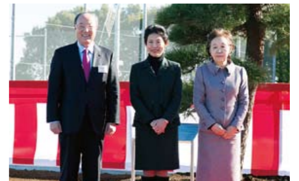
親善試合に先立ち、黒松の記念植樹を終えて

試合後、水田記念ホールに会場を移して地域の皆様とご来賓の皆様、両学関係者とのレセプションも催され、サッカーを通して両学の国際交流をさらに深めることができました。