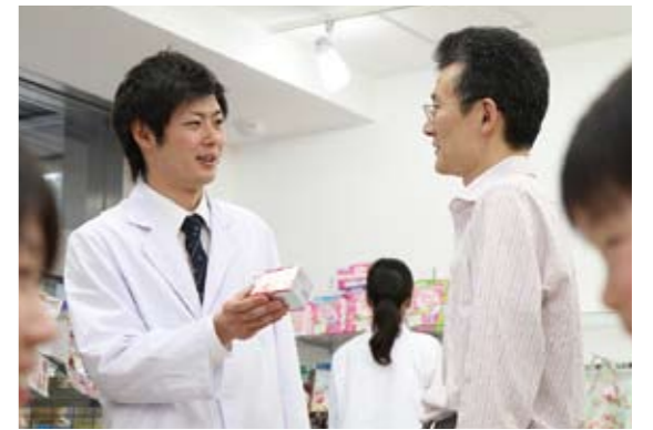
地域に役立つ薬剤師育成を目指して

プログラムの中で、現在薬剤師の関与が強く望まれている職務である「放射性医薬品調製・管理業務」、「病棟活動における専門職連携」、「救急災害時医療活動」、「在宅医療での薬剤管理指導」、「違法薬物、医薬品適正使用、ドーピングの知識普及・啓発活動」について、アクティブ・ラーニングを取り入れた実践社会薬学教育プログラムを三大学で協働して作成します。本学は、そのうち、在宅医療実践に資する薬剤師の養成を中心に5年間にわたり取り組む予定です。