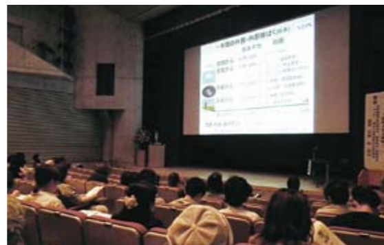
生涯教育講座の様子

参加された近隣の方や医療現場の関係者の方々は皆熱心に先生のお話を聴講され、講演後は活発な質疑応答がなされました。