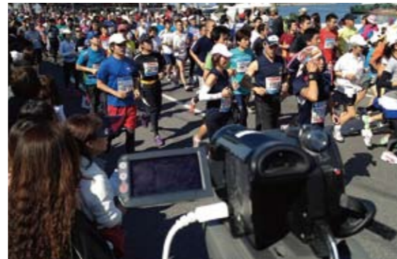
アクアラインマラソンの中継

「アクアラインマラソン中継」は、1万人以上のユニークユーザーを記録するなど、いずれの中継も多くの視聴者数があり、インターネットを通じてイベントを発信することへの需要の高さを実感する重要なプロジェクトとなっています。