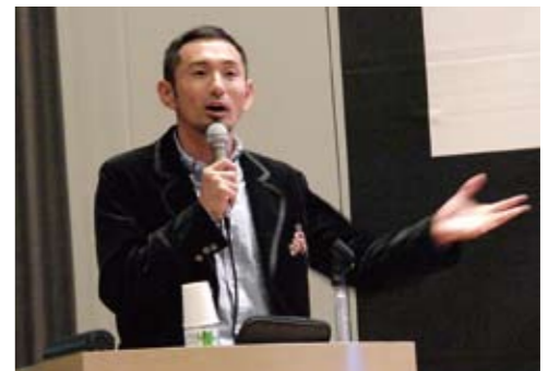
為末氏の記念講演