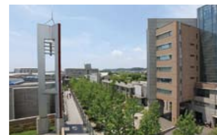
❖ JIUランドスケープデザイン

城西国際大学では、自然景観と調和したキャンパスを目指してきました。そのランドスケープデザインに対し、「端正な中にも透明感と伸びやかさ」がある「成長するキャンパス」との評価を受け、日本建築学会賞と日本造園学会賞を受賞しました。