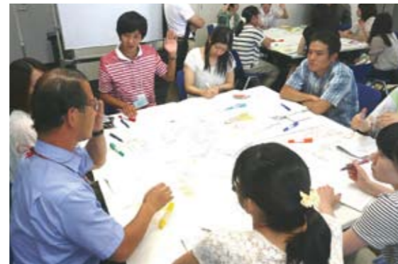
セミナーでの討議風景

参加した本学の学生からは、「多職種と連携して地域を支援できる専門職を目指したい」「患者さんに寄り添える専門職を目指したい」などの声がありました。また、地域の人々や他大学・他学部生との出会いは、ふだんの大学生活では感じえない多くの気づきを学生にもたらしました。参加した学生それぞれの、今後の成長と医療業界での将来の活躍が期待されます。