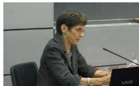
カプラン博士の講演