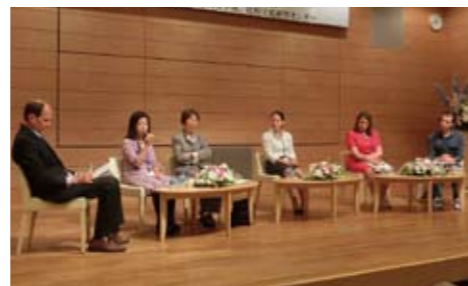
ディスカッションのようす