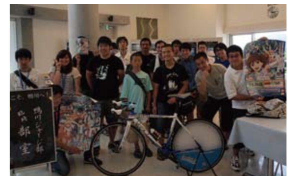
サミットの出席者たち

なお、当日行われた鴨川納涼花火大会でも、観光学部の学生たちが鴨川市観光協会の協力を得て「輪廻のラグランジェ特設ブース」を開設し、ブースの展示から運営、商品販売の管理までを学生たちが取り仕切りしました。