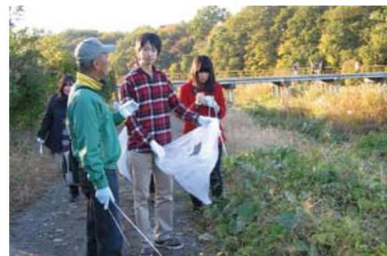
「ふるさとの会」の方とゴミを収集

4班に分かれて大学に隣接する高麗川右岸の河川敷で清掃を行い、短時間で軽トラック1台分ものごみが集まりました。今回の活動は清掃ボランティアだけでなく、大学外のさまざまな年齢の方たちと共通の目的を持って交流する良い機会となりました。