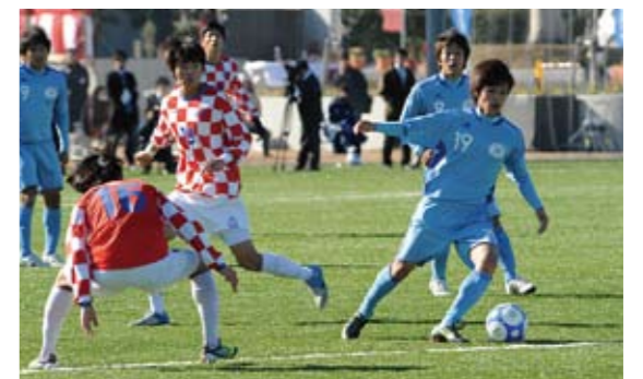
親善試合での白熱したプレー