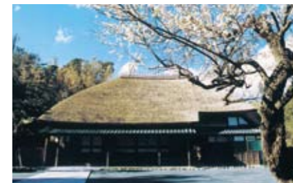
❖ 旧水田家住宅(母屋)

地域の特性や周辺環境に十分な配慮がなされ、建築物と外部空間が一体となって魅力ある景観を創出したことを評価され第10回千葉県建築文化賞を受賞しています。