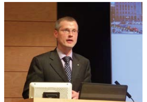
講演されるトムシーク副総裁

2012年10月16日、チェコの国立銀行副総裁ヴラジミール・トムシーク氏が東京・紀尾井町キャンパスに来学し、講演を行いました。