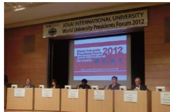
壇上の参加大学学長達

会場には、本学と交流の深いハンガリー、ポーランド、チェコ、ブルガリアの大使をはじめとする大使館関係者、政府・経済団体、企業、他大学関係者など約200名が集まり、グローバルコミュニケーションの重要性や各国の実情に合わせた具体的な目標・活動の重要性の共通認識を深めました。