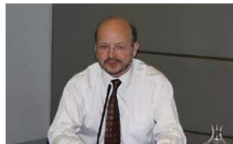
レムコウ博士の講演