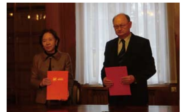
ポーランド・ウッチ大学との調印式にて