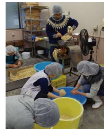
味噌の加工の様子