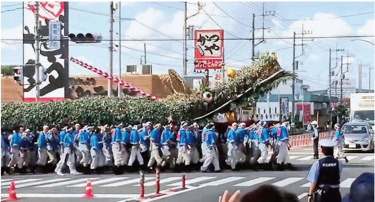
脚折雨乞い 2016 龍神国道横断（埼玉県鶴ヶ島市）

大蛇を見たという遭遇談や、大蛇が何かをした、池に龍がいて云々といった伝説は数多く存在していて、祭りとなって現代に生きているものも少なくない。埼玉県にある城西大学近辺でいえば、鶴ヶ島市の脚折雨乞（すねおりあまごい）は、祭りのパンフレットの言葉を使えば「四年に一度、巨大な龍蛇が練り歩く」。全長30mを超える龍蛇は龍神となって300人を超える担ぎ手で白鬚神社から雷電池（かんだちがいけ）へと練り歩き、雨乞祈願の後に宝珠奪いでバラバラに分解される。途中、国道407号交差点の通行を止めて横断する様は何が起こったのかと目を疑うほどの光景だ。