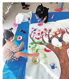
写真5：作品制作の様子

本企画は、木の部分だけが描かれた用紙に、手に塗った絵具で手形を付けていき、全員で一つのアート作品を完成させるというものである。完成した作品は城西大学水田美術館に展示された。