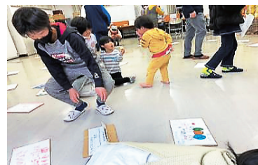
写真1：人間すごろくの様子

すごろくのマスは、子どもたち、学生、子ども食堂に来た地域の方たちと合計で約50枚作製した。人間すごろくは、ごほうびマス、クイズのマスなどの様々な種類のマスを自由に配置にすることができるため、配置を工夫することで遊び方の幅が広がった。