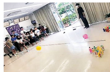
写真2：チーム戦の様子

ペットボトルボウリングでは、空きのペットボトルをボウリングのピンとして再使用した。当日は、個人でのボウリングの他に、2チームに分かれたチーム戦を行った。また、ピンの側面に1から10までの点数を張り付けるといった工夫をした。これにより、通常のボウリングに加えて倒したピンの合計得点を競う遊びもできるようにした。