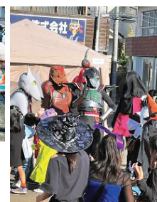
写真4：ヒーローとの撮影会