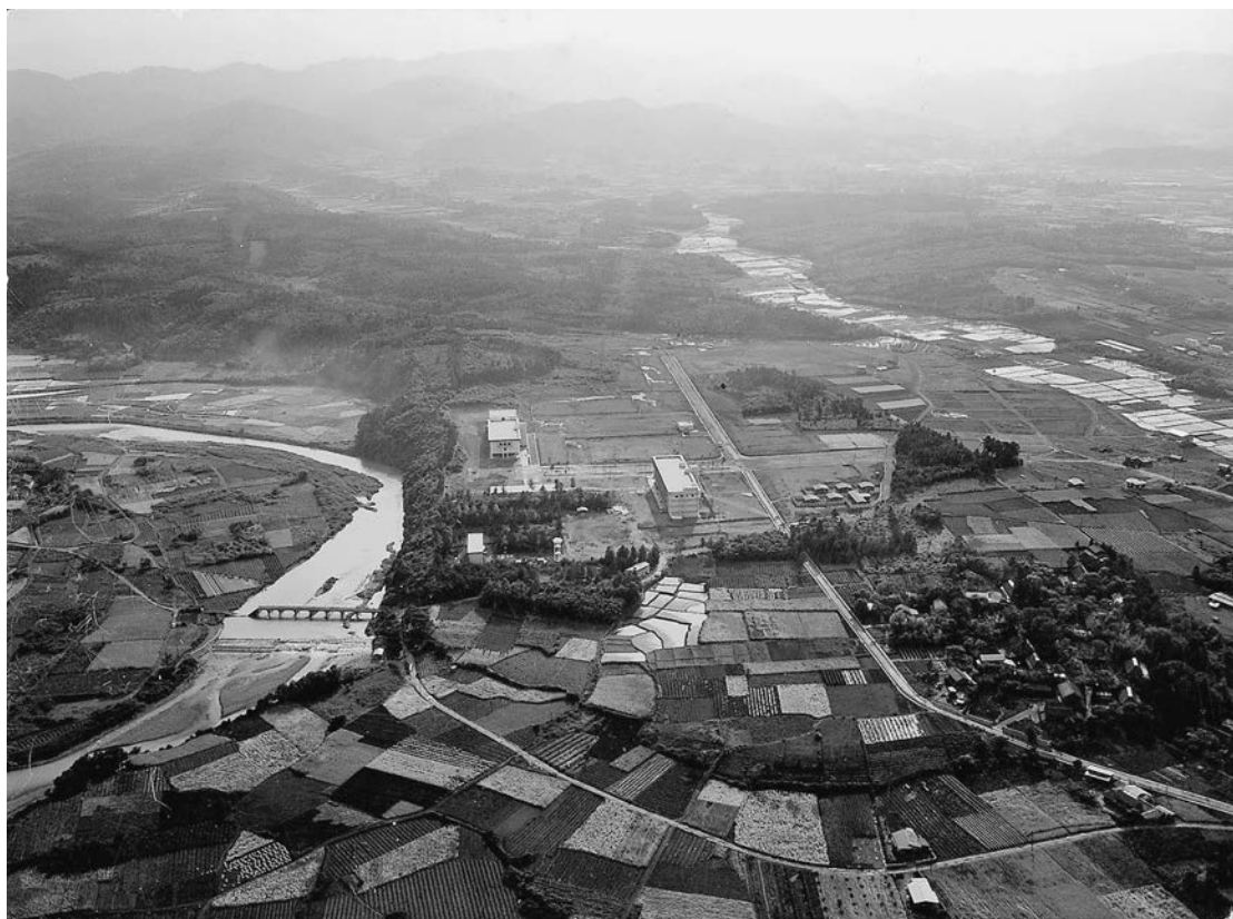
図2 昭和41年の城西大学。城西歯科大学（現 明海大学歯学部）建設でなくなった道がよく分かる。1号館の右にある道を挟んで見える数軒は女子寮。多和目橋は昭和40年8月の台風17号で一部が落ちてしまった。

当時はまだ町制だった坂戸市はどうだったのでしょうか。開校前後に発行の『広報さかど』をみましたが、城西大学については何も見つけられませんでした。唯一、昭和40年11月号に17号台風で災害を受けた多和目橋の写真がありました。南から北方向へ撮った写真で、今ならば18号館や21号館が見えるだろう所には林があるだけで、城西大学の存在にもふれていません。