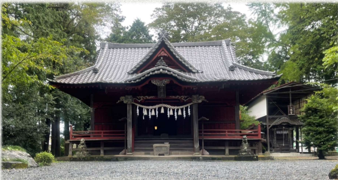
▲棕神社は龍勢の社、秩父事件で知られている