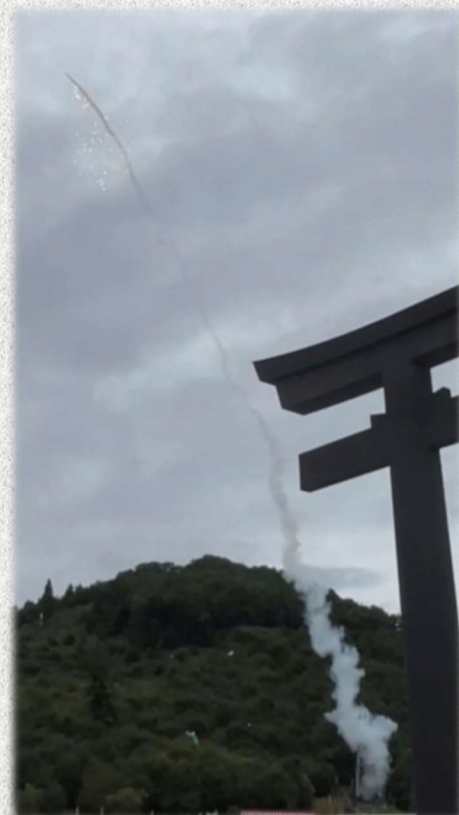
▲龍勢の打ち上げ櫓と打ち上げ