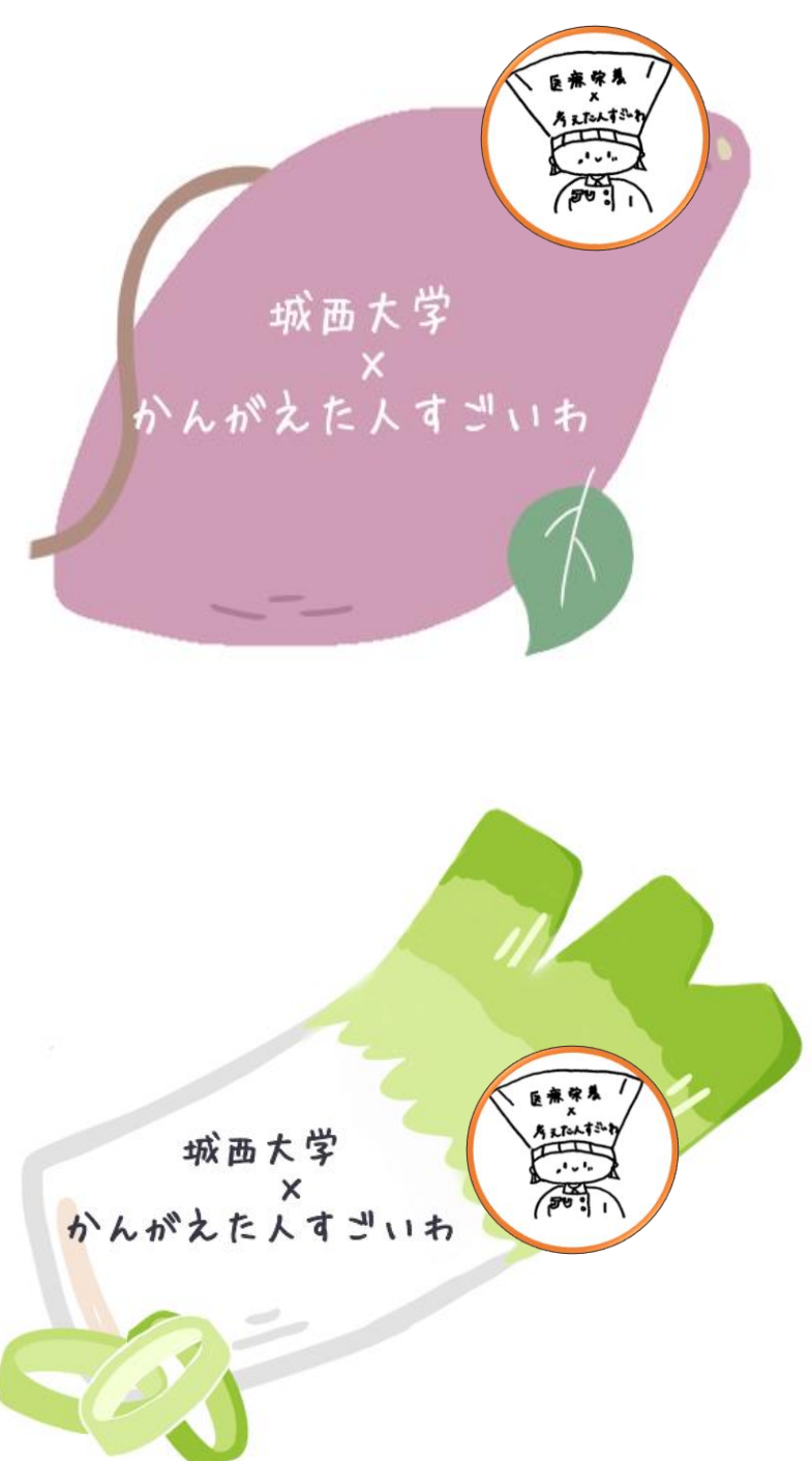
パッケージに貼るシール (製作中) ↑