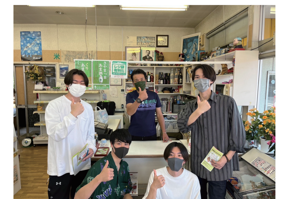
十一屋さんへの取材