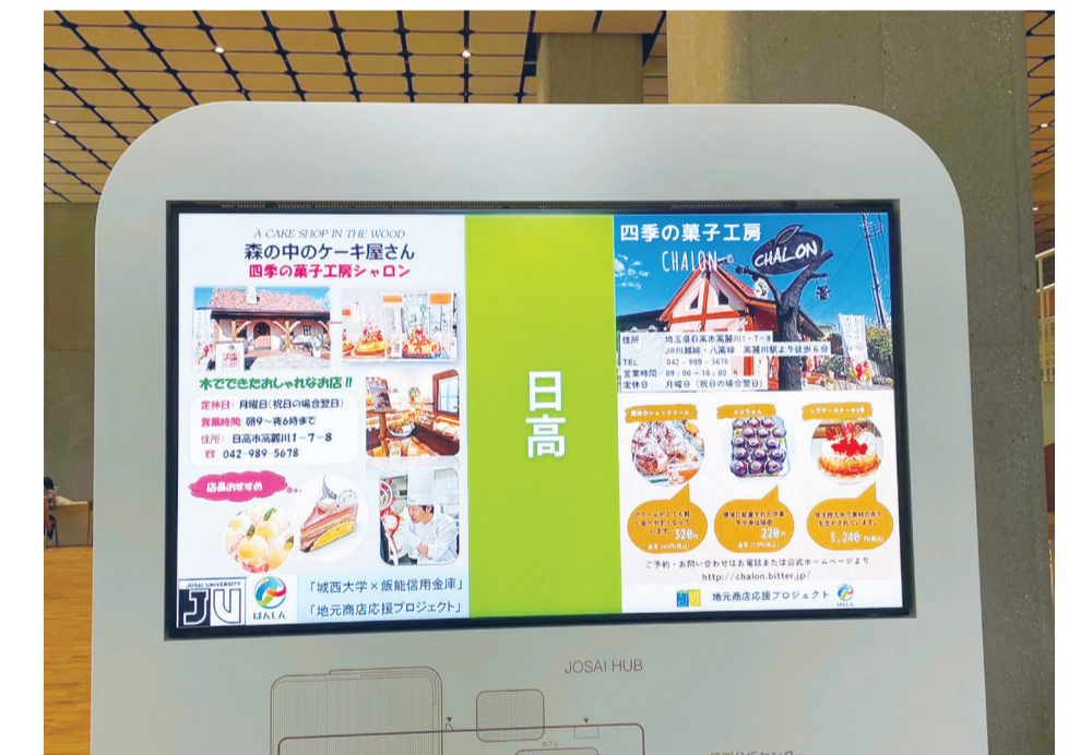
本学 23号館のデジタルサイネージ