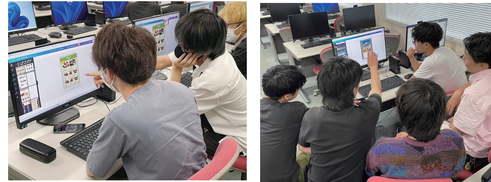
チームで事業所のチラシを作成している様子。

撮影した写真や情報をチラシに反映していく CHALONさんではおすすめの3つの商品をピックアップ