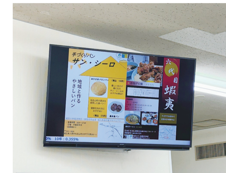
はんしん東飯能支店様でのデジタルサイネージ

作成したチラシは各店舗で配布されたほか、本学や飯能信用金庫各営業店のデジタルサイネージ（電子看板）、および飯能信用金庫の公式LINEなどでも掲示され、地元商店や町の魅力を広く発信することができました。