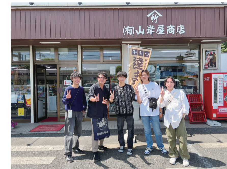
山岸商店さんへの取材