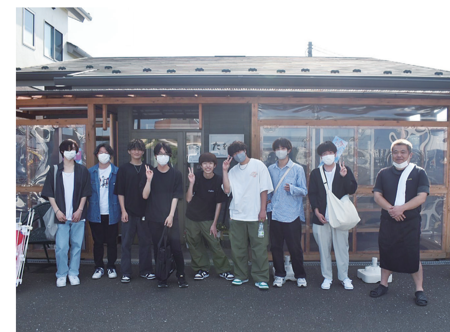
たを香さんへの取材