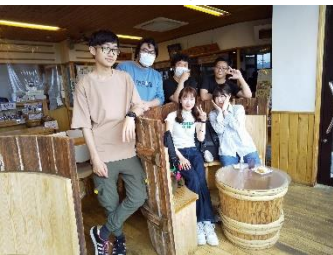
醬遊王国・弓削多番油見学