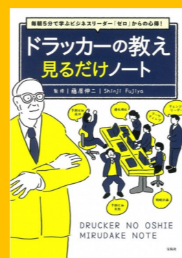
「ドラッカーの教え見るだけノート」 ：毎朝5分で学ぶビジネスリーダー「ゼロ」からの心得!」 藤屋伸二監修 宝島社、2021. 配架場所 3F(336//F68)