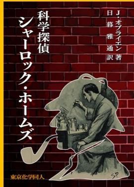
「科学探偵シャーロック・ホームズ」 ジェームズ・オプライエン著 日暮雅通訳 東京化学同人、2021. 配架場所 2F(930.28//D89)