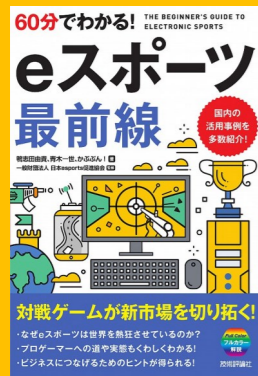
「60分でわかる!eスポーツ最前線」 嶋志田由貴、青木一世、かぶぶん!著 技術評論社、2020. 配架場所 2F(798.5//Ka41)