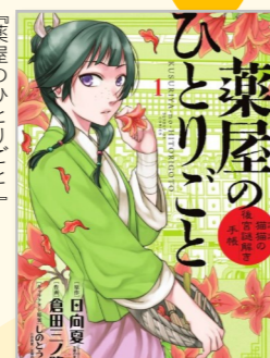
日向夏原作、倉田三ノ路作画、しとうこキャラクター原案 小学館(サンデーGXコミックス)