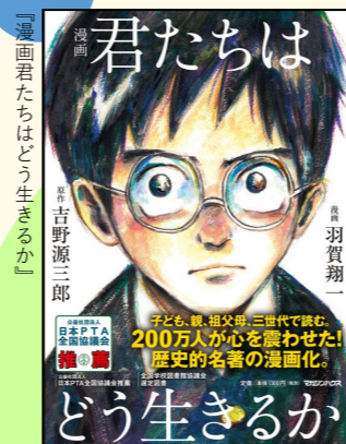
吉野源三郎原作、羽賀翔一漫画 マガジンハウス