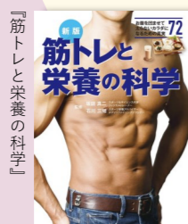
坂詰真二、石川三知監修 新星出版社