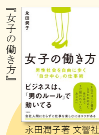
永田潤子著 文響社