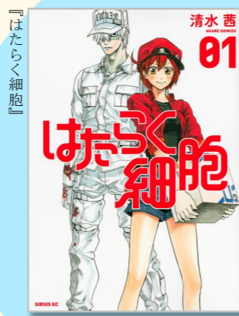
清水茜著 講談社 (シリウスKC)