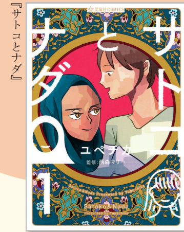
ユベチカ著 星海社comics