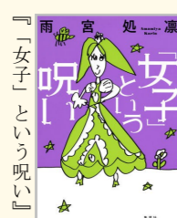
雨宮処凛著 集英社クリエイティブ