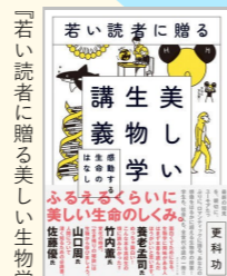
更科功著 ダイヤモンド社