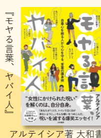
アルティシア著 大和書房