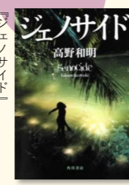
高野和明著 角川書店