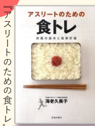
海老久美子著 池田書店