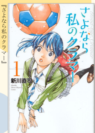
新川直司著 講談社 (講談社コミックス)