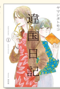
ヤマシタトモコ著 祥伝社 (FC swing)