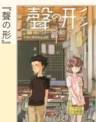
大今良時著 講談社 (講談社コミックス)