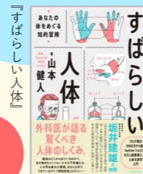
山本健人著 ダイヤモンド社