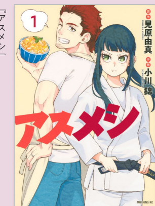
見原由真原作、小川錦作画 講談社 (モーニングKC)