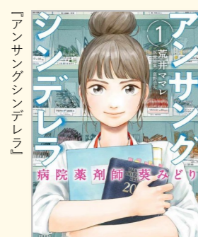
荒井ママレ著、富野浩充医療原案 ノース・スターズ・ピクチャーズ