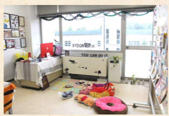
どこを見ても素敵なお部屋の先生研究室