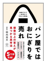
『パン屋ではおに ぎりを売れ：想像 以上の答えが見つ かる思考法』 柿内尚文著, かんき出版