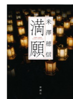
『満願』(新潮文庫) 米澤穂信著, 新潮社 *図書館では単行本を 所蔵しています。