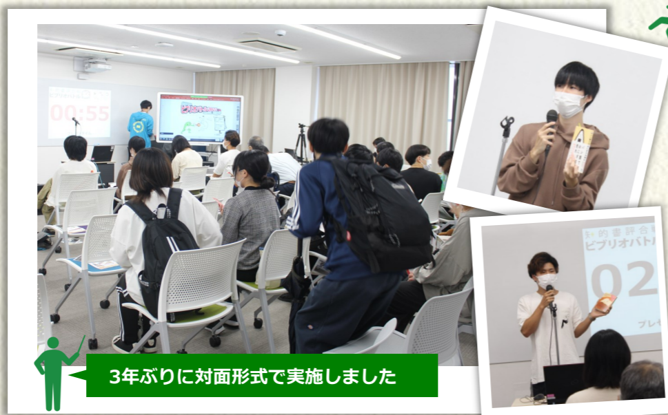
3年ぶりに対面形式で実施しました

10月5日（水）、「全国大学ビブリオバトル2022 地区予選 城西大学」を開催しました！！ ビブリオバトルとは、制限時間5分間でおすすめの本を紹介しあう書評ゲームです。