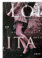
『ロリータ』(新潮 文庫) ナボコフ [著] ; 若島正訳, 新訳版, 新潮 社 *図書館では単行本を 所蔵しています。