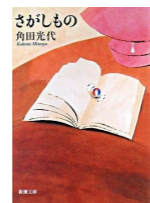
『さかしもの』 (新潮文庫) 角田光代著、新潮社