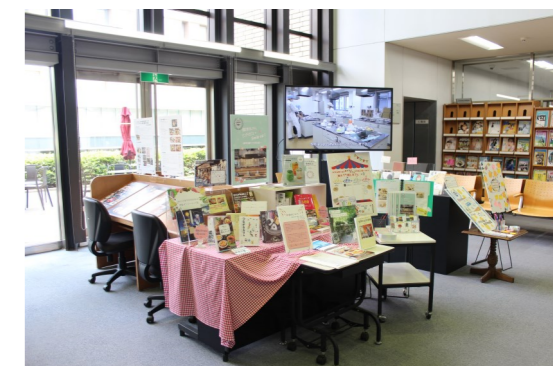
図書館1階ブラウジングコーナーで展示しています

今回の図書館と医療栄養学科のコラボ展示では、学生たちがカフェのレシピを考える際に実際に参考にした書籍を中心にカフェにまつわる図書を展示しています。学生たちがカフェの活動に参加した経験を記したコメントの展示もあります。また、皆さんの「推しカフェ」を教えてくださいコーナーも設置し、図書館に来ていただいた皆さんと近隣の推しカフェ情報が共有できる内容となっています。本や推しカフェ情報とともに、学生たちが大学から飛び出して地域の中で学ぶ様子をぜひご覧ください。