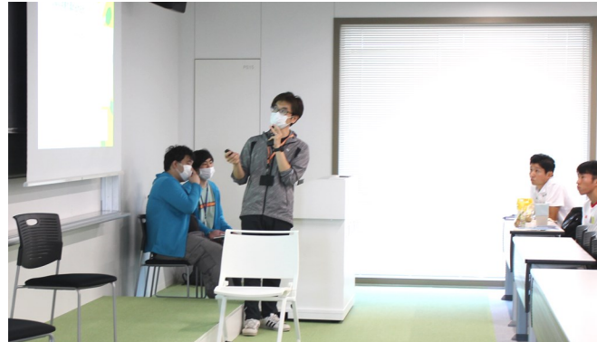
伊東先生よりキウイフルーツの効能について、アスリートへの効果を研究した論文やデータをもとに、分かりやすくお話いただきました。