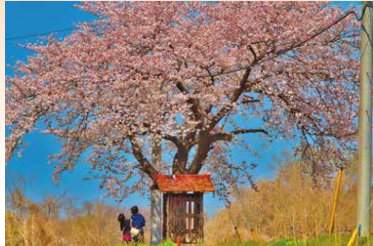
観光編 いきいき坂戸部門 最優秀賞 『吉原地蔵の一本桜』

※当館へのご来館は事前予約制となります。詳しくはHPをご覧ください。 (049-271-7327) ※新型コロナウイルス感染症の感染状況により、展覧会及びイベントに変更が出る場合もあります。予めご了承ください。