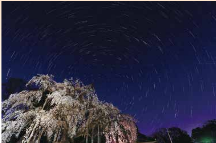
観光編 自然・風景部門 最優秀賞 『慈眼寺夜桜』

本学のある埼玉県坂戸市では、2015年度より「めつけたさかど! デジタルフォトコンテスト」を毎年開き、坂戸市民や坂戸市を訪れた人たちが市内でめつけた(見つけた)四季折々の自然やまちの風景、行事などを思い思いに撮影した写真のコンテストを行っています。地域の魅力を伝える一助となるよう、2017年度よりコンテストの入賞作品を当館でご紹介、たくさんの方にご覧頂いてきました。 そして、今年度も引き続き開催することとなりました。坂戸よさこいが2019年の台風の影響で中止となり「坂戸よさこい編」の募集はありませんでしたが、「観光編」より「いきいき坂戸部門」と「自然・風景部門」への応募の中から選ばれた最優秀賞・優秀賞・入選の入賞作品に、最終選考まで残った作品も加えた合計38点をパネルにしてご覧頂きます。 本展を通して、坂戸市の新たな魅力をめけてみませんか?