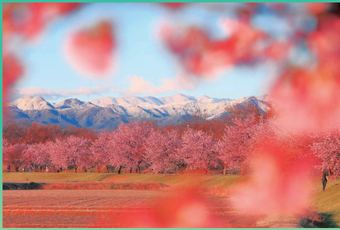
観光編 自然・風景部門 最優秀賞 『さくらの額縁』