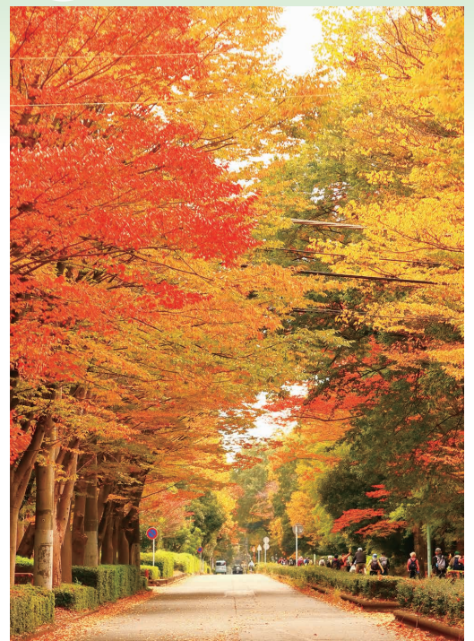
観光編 いきいき坂戸部門 最優秀賞 『紅葉のトンネル』

本展を通して、坂戸市の新たな魅力をめつけて頂き、写真に込められた想いやパワーをぜひ感じて下さい!