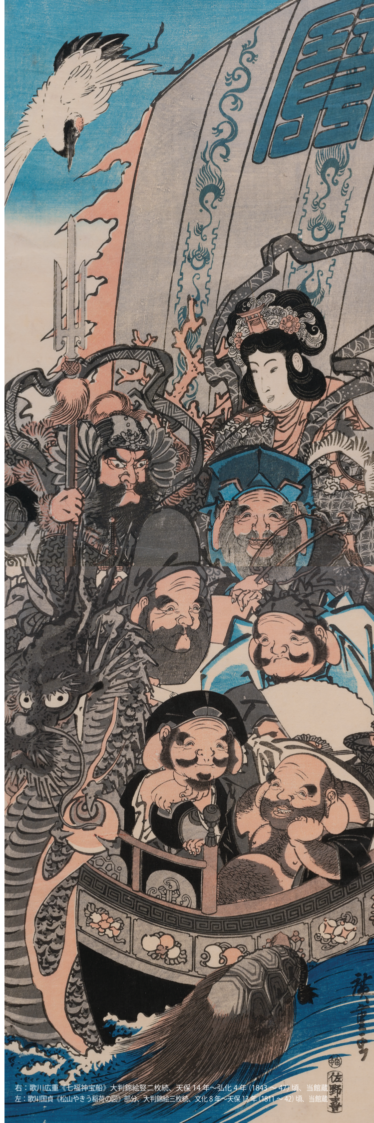
右：歌川広重「七福神宝船」大判錦絵段二枚続、天保14年~弘化4年(1843~47)頃、当館蔵 左：歌川国貞「松山やきう稲荷の図」部分、大判錦絵三枚続、文化8年~天保13年(1811~42)頃、当館蔵