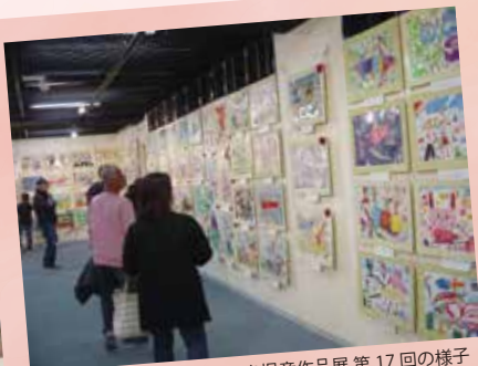
2. MOA美術館 坂戸・鶴ヶ島児童作品展 第17回の様子