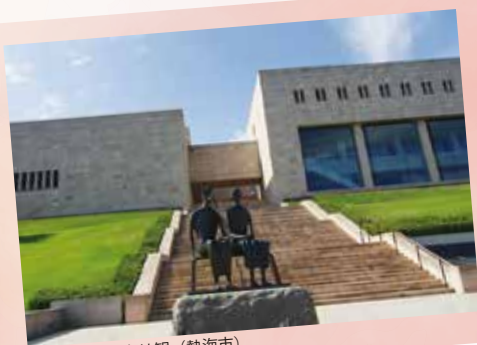
1. MOA美術館 外観 (熱海市)

今回のMOA美術館児童作品展で学んだことを生かし継続性をもたせる活動にするためにどのようにしていけばいいかを考えていきたいと思っています。また、これまで以上に多くの方に参加、来場していただけるような活動にしていきたいです。今後も活動を通してたくさんの方の顔があふれ、そんな居場所を作るためのサポートをしていきたいです。