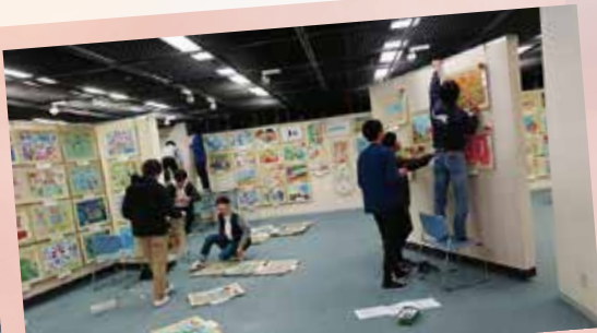
3. アーツ・イン・エデュケーションによる第17回展示作業風景

アーツ・イン・エデュケーションという団体名を使用したのは2年前からです。活動に名前を付けた大きな理由は、在学生だけでなく、卒業生も地域の皆さまにも、児童作品展という活動にいつでも参加できる「場」の提供をしたいという目標を持ったからです。この活動が好きならいつまでも児童作品展にかかわる仲間でありたいと思います。