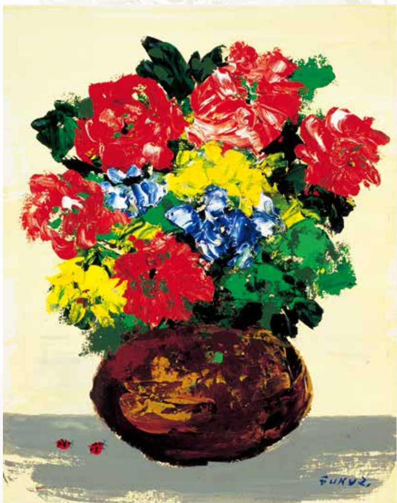
上:野口弥太郎《上海》油彩、キャンパス、45.5×53.0cm、1941年〔前期展示〕 下:福沢一郎《花とてんとう虫》アクリル、キャンパス、41.0×32.0cm、1974年〔後期展示〕