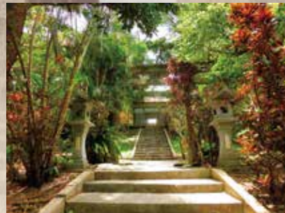
佐敷グスク内に鎮座する第一尚氏王統を祀る月代宮