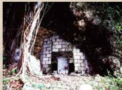
読谷村伊良皆の「サチキムイ」にある尚巴志王之墓