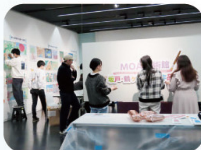
3. 実行委員会、アーツ・イン・エデュケーションによる第21回展示作業風景