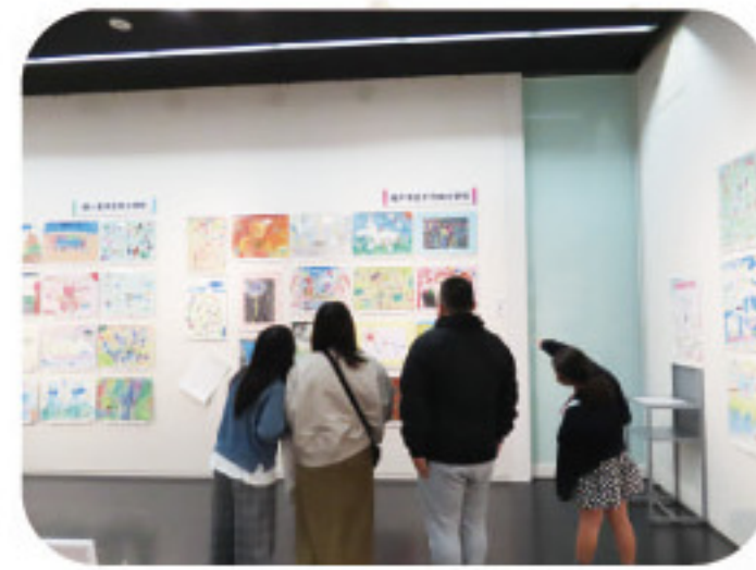
2. 第21回MOA美術館 坂戸・鶴ヶ島児童作品展の様子