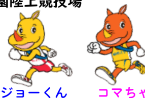
ジヨーくん コマちゃん 城西大学のマスコットキャラクター

2024年1月2日(火)~3日(水) 8:00 START! 東京大手町~箱根・芦ノ湖 往復 日本テレビ系列で全国生中継!