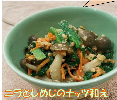
(左図)農林水産省X(旧Twitter, @MAFF_JAPAN)より画像引用

普段私たちが目にする植物には、有毒な成分を含むものがあります。その中には野菜や山菜などの食べられる植物と見た目がそっくりなものもあるため、誤って有毒植物を食べたことにより食中毒を起こす事故が毎年発生しています。代表的な有毒植物のひとつがスイセンです。毎年春ごろにスイセンの葉をニラと誤って食べる事例が多く、誤食によって30分以内に吐き気や下痢、頭痛などの症状を起こします。 身近に潜む危険から身を守るために、鑑賞用植物と野菜を近くで栽培することはやめましょう。また、確実に食用だと判断できない植物は「採らない」「食べない」「売らない」「人にあげない」ように気を付けて、念のため調理前にも一度確認すると良いですよ。 もし植物を食べて体調が悪くなったなら、すぐに医師の診察を受けてください