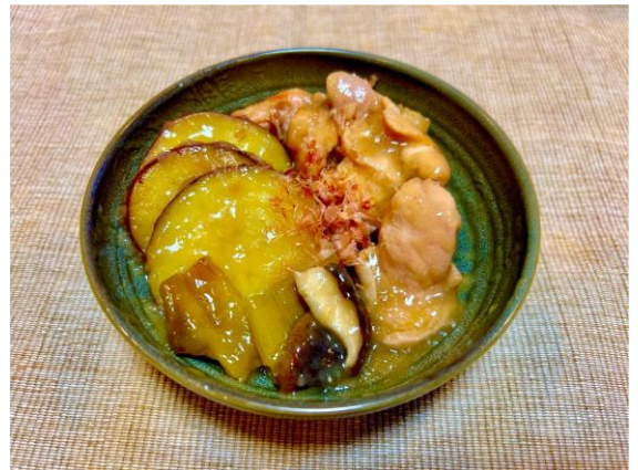
埼玉「地三品(じさんひん)」煮

埼玉県の地産品といえばさつまいもを思い浮かべる人が多いと思いますが、はちみつも埼玉県の地産品なのです！はちみつにはこれからの暑い夏を乗り切るためのミネラルのカルウム、ブドウ糖や果糖が豊富に含まれています。カルウムは体内の水分保持に有効であり、ブドウ糖や果糖はエネルギー源になります。 みなさんは、はちみつを普段どのように使っていますか。パンやヨーグルトにそのままかけたり、レモンやカリンをそのままはちみつにつけたりすることが多いように感じます。 そこで今回は、はちみつを鶏肉の下味に使用した「埼玉地三品煮」を紹介したいと思います。埼玉県の地産品であるさつまいも、ねぎ、はちみつの三品を詰め込んでみました。はちみつの調理特性として甘い風味や砂糖では引き出せない照りやコクが引き出すことができます。はちみつの風味がほんのりと感じられる煮物で大変美味しいです。はちみつでこの夏を乗り越えましょう！